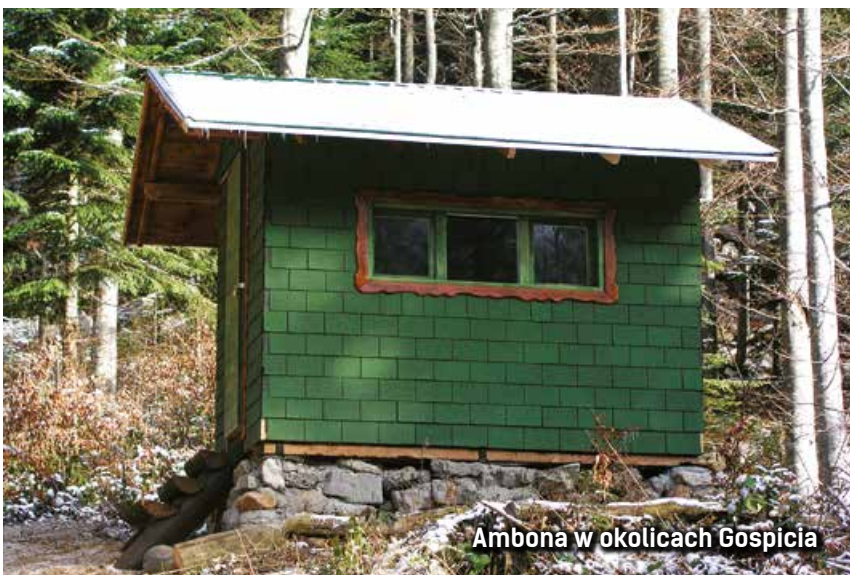
Ambona w okolicach Gospicia

w wyniku wypadków komunikacyjnych i w innych okolicznościach niezwiązanych z polowaniem. Warto jednak nadmienić, że co roku 20-25% licencji na odstrzał jest zwracanych z powodu jego niewykonania. W razie zwrotu takiego pozwolenia w następnym sezonie łowieckim właściciel terenu otrzymuje liczbę zezwoleń pomniejszoną o tyle, ile licencji oddano w poprzednim roku. Ten system sprawia, że właścicielom terenów łowieckich bardzo zależy na efektywnym pozyskaniu niedźwiedzi przez zaproszonych na polowanie klientów. Łowy w większości przypadków są naprawdę dobrze przygotowane, a ambony – solidnie zrobione, wysokie i zapewniające bezpieczeństwo myśliwym. Doświadczeni chorwaccy podprowadzający, uzbrojeni po zęby ▶