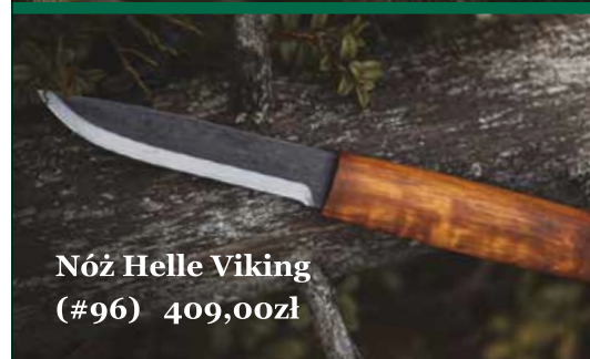
Nóż Helle Viking (#96) 409,00zł