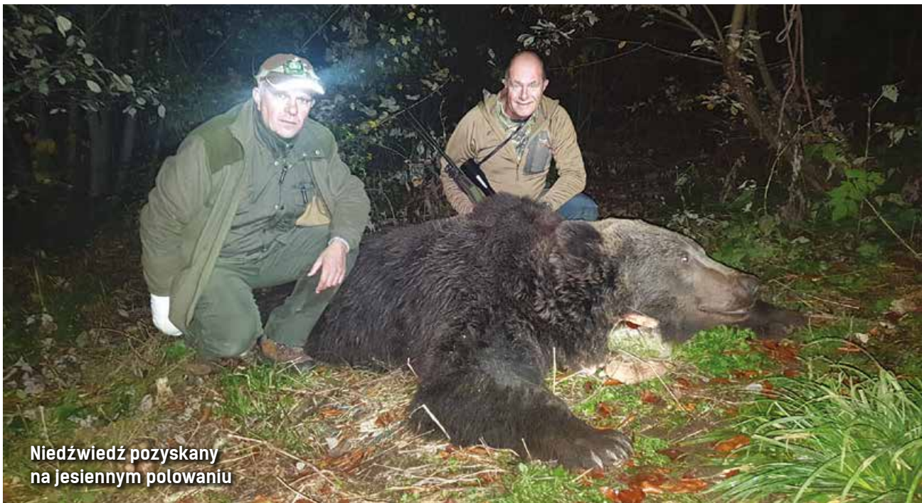
Niedźwiedź pozyskany na jesiennym polowaniu

we wszystkie myśliwskie urzędnictwa pomagające w polowaniu, starają się, aby klient zdobył upragnione trofeum.