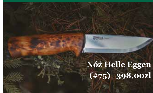
Nóż Helle Eggen (#75) 398,00zł