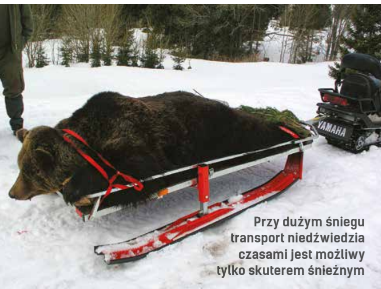
Przy dużym śniegu transport niedźwiedzia czasami jest możliwy tylko skuterem śnieżnym

W zależności od regionu waga chorwackich niedźwiedzi waha się od 100 do 350 kg, przy wzroście od 1,7 do 2,2 m, nie ma zatem problemu z uzyskaniem powyżej 300 pkt CIC i ze złotym medalem. ●