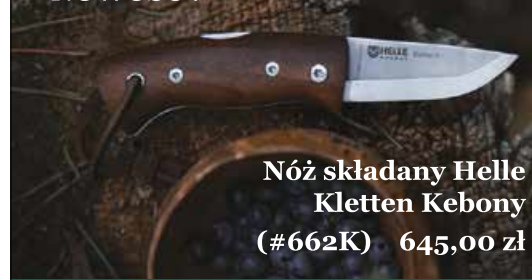
Nóż składany Helle Kletten Kebony (#662K) 645,00 zł