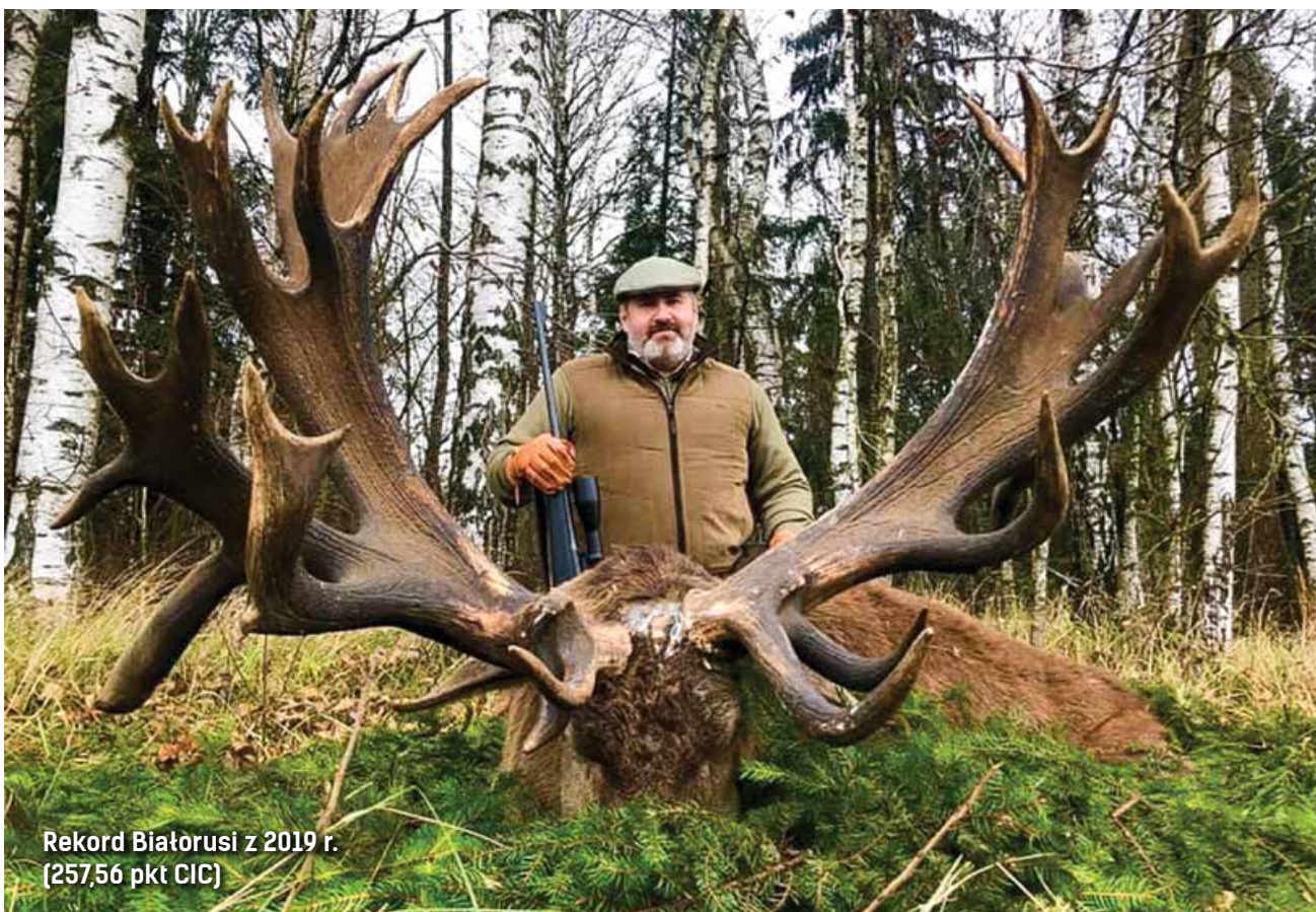
Rekord Białorusi z 2019 r. (257,56 pkt CIC)