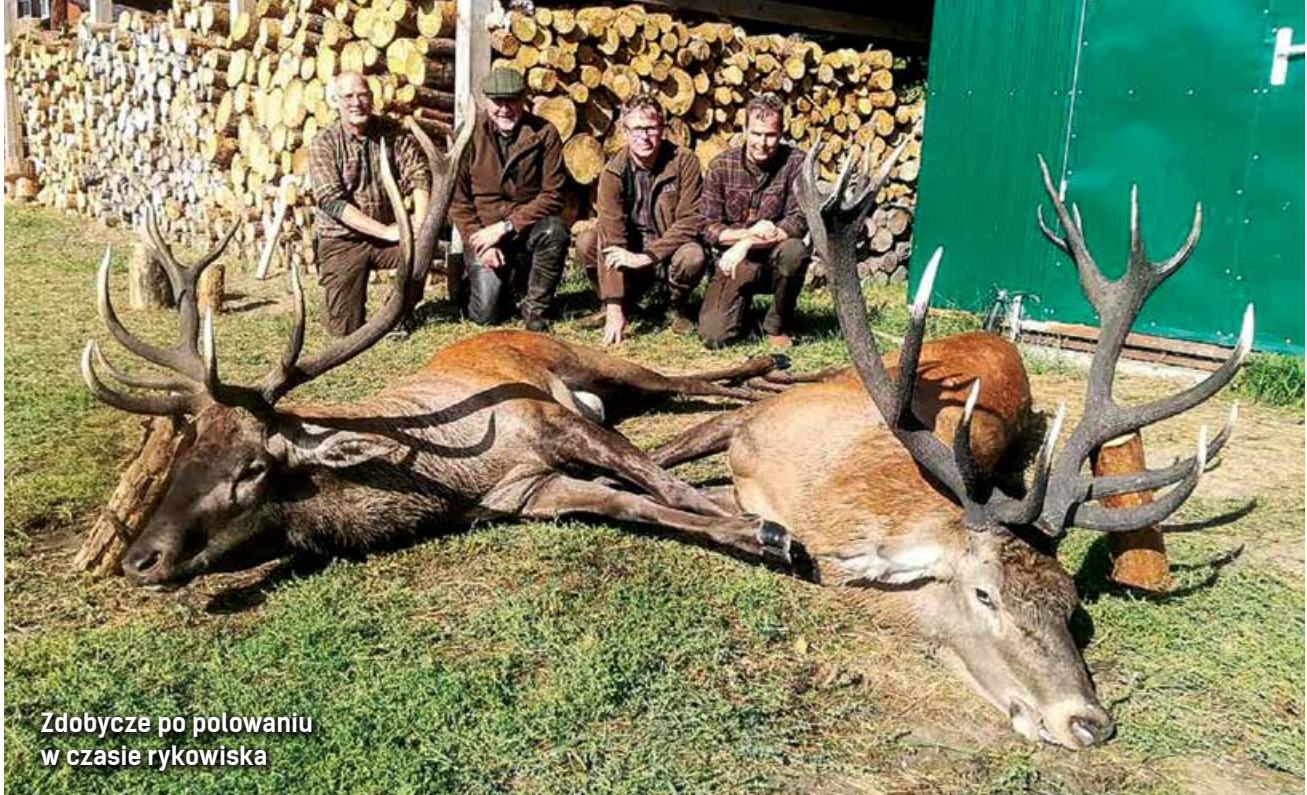
Zdobycze po polowaniu w czasie rykowiska

ale bez wątplenia najpiękniejszy czas na pozyskanie jelenia stanowi rykowisko. W północnej części kraju zaczyna się ono gdzieś 15 września, a na południu – już wcześniej, 3–5 września. Czym jest białoruskie rykowisko? To prawdziwy koncert dziewiczej przyrody.